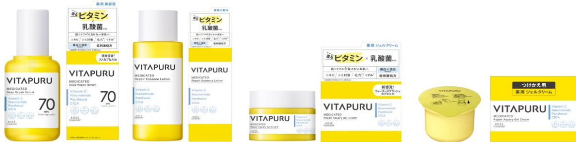
① ② ③ ④