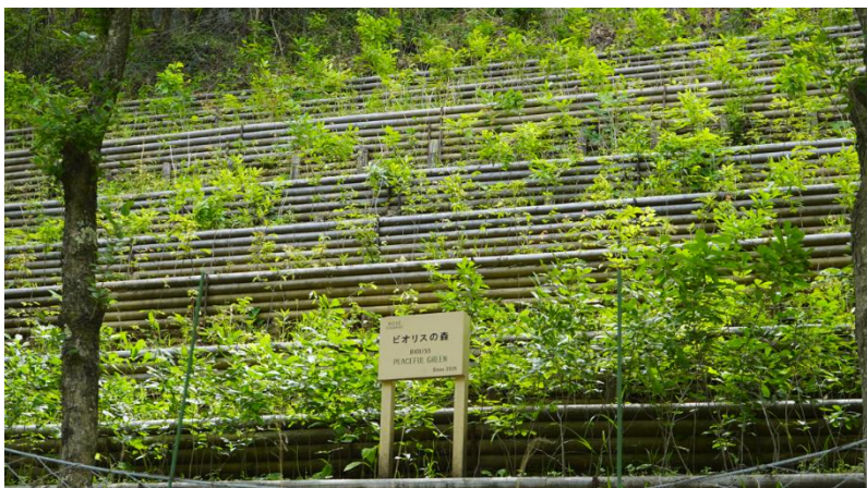
【足尾銅山】昨年(2025年)植樹した斜面の現在。1年で豊かな緑が根付きました。